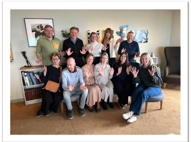
Våra nyutbildade utbildare i Lösningfokus har träffats i Tällberg för att dela erfarenheter. De träffas kontinuerligt och skapar möjligheter till fortsatt utveckling!

Vi har nu utbildat 13 utbildare inom Lösningfokus, 24 utbildare i BIPs progressionsverktyg samt 23 utbildare i samverkansutbildningen. Detta gör att vi kan nå ut till ännu fler och ytterligare stärka kompetensen för samverkan och stöd i hela regionen. Det finns platser kvar till den kommande tillfället för att bli utbildare i BIP-verktyget i maj! Läs mer och anmäl dig här!